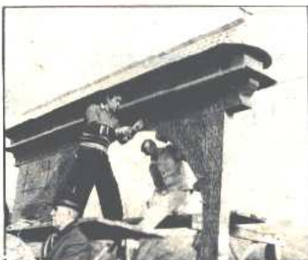
Felállítják az új kötetet alkalmát